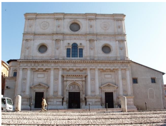
Basilica S. Bernardino da Siena