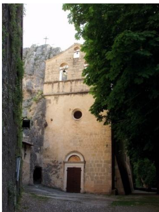
Santuario Madonna dell'Appari