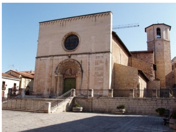
San Pietro Coppito