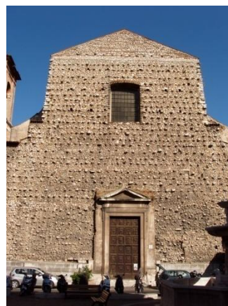
Chiesa Santa Margherita