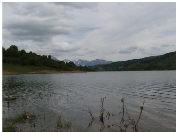
Lago di Campotosto