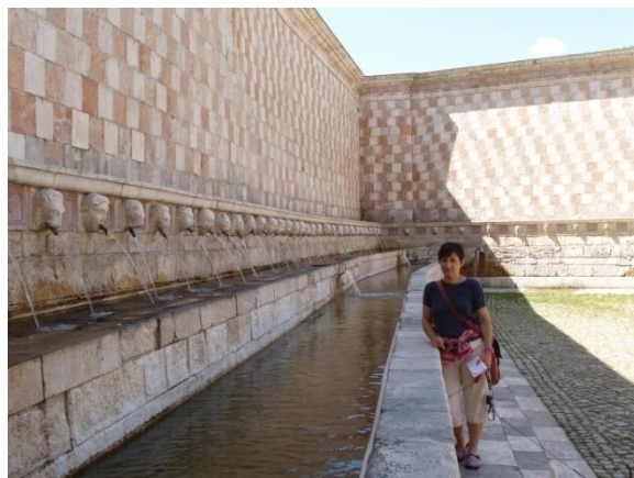
Fontana delle 99 Cannelle