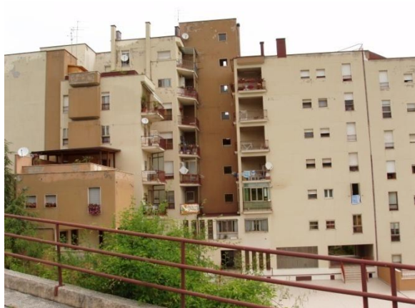
Contrada Colle dell'Orso